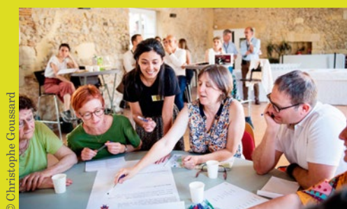
Atelier participatif du 17 mai 2022, secteur La Clairière-Ermitage.

Les ateliers à venir permettront d'aborder les questions spécifiques à chaque secteur, afin de prendre en compte l'avis des Gradignanaïses et Gradignanaïses.